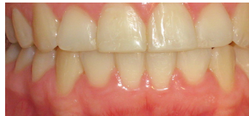
(Fig. 4) Notable mejoría de la encía.