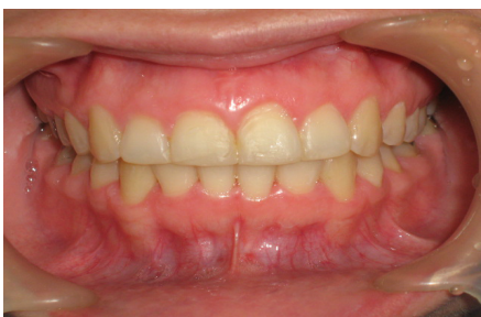
Fig. 1) Se observa agrandamiento gingival en encía vestibular de maxilar inferior.

Paciente masculino de 32 años de edad, se presenta a la consulta con un notable agrandamiento gingival idiopático abarcando la encía vestibular de maxilar inferior. Al sondeo se encontraron profundidades entre 5 y 7mm en órganos dentarios inferiores con presencia de sangrado. El crecimiento gingival mostraba un aspecto de lobulaciones. La encía presentaba un color rosado pálido, de consistencia resiliente, de aspecto granulado a pesar de un índice de placa elevado y la mala higiene bucal del paciente. (Figura 1) La historia médica del paciente no reportó ningún antecedente de importancia.