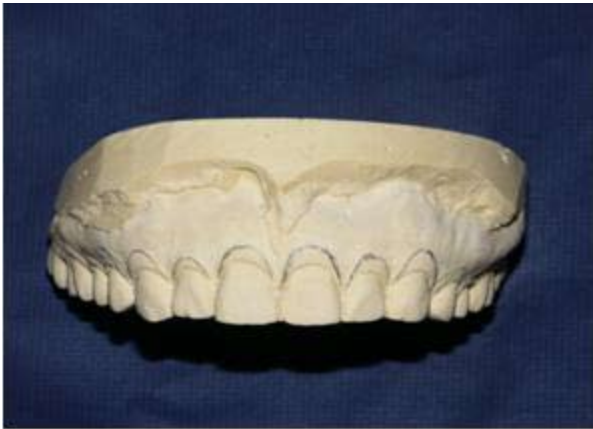
Figura 2. Demarcación de la encía a eliminar.