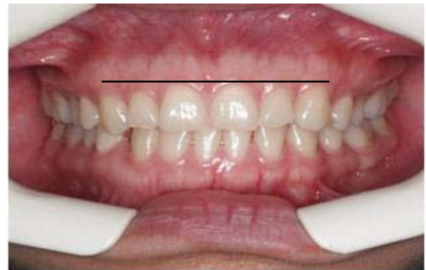
Figura 1. Situación en la cual llega la paciente.

En la figura 1 se observa la situación oral con la cual llega la paciente. En la que se observa sonrisa gingival la cual no corresponde a una sonrisa estética, armónica o aceptable desde la mirada de los parámetros expuestos.