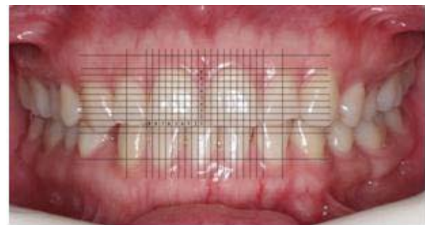
Figura 1.1. Análisis en computador