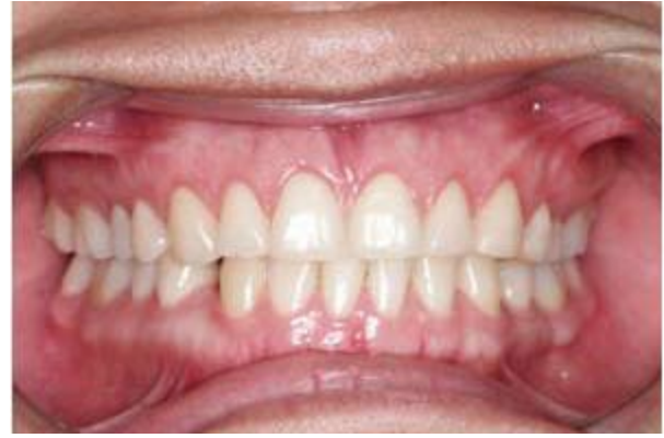
Figura 6. Postoperatorio.

Los parámetros estéticos son cruciales para un diagnóstico correcto y un adecuado plan de tratamiento.