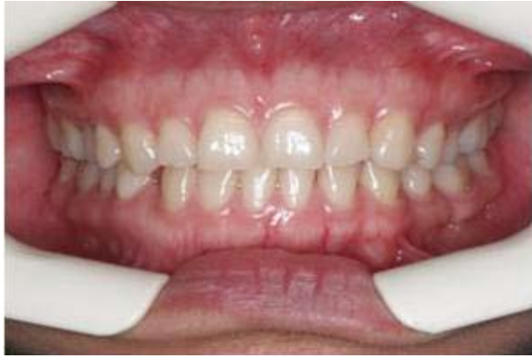
Figura 5. Preoperatorio.

permitirá ajustar el diseño de la nueva sonrisa y tener una mejor seguridad del trabajo realizado, dándole ubicación individualizada a cada punto cenit y a cada margen gingival. Figura 4.