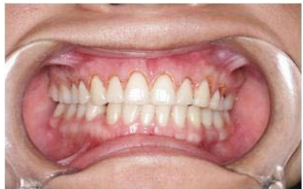
Figura 4. Imagen de la encía luego del recorte inicial con la plantilla.

La plantilla se retira de la boca de la paciente y se proceden a realizar unos nuevos recortes de la encía en diferentes sitios como son a nivel intrasurcular, a nivel interproximal y marginal sin la plantilla, lo que