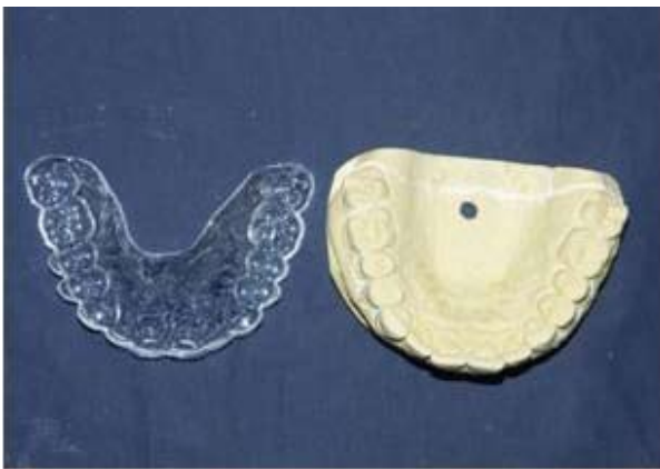
Figura 3. Elaboración de la plantilla en modelo de yeso de la paciente.

Se toman fotos intraorales con cámara Nikon D70S, lente macro 100 Nikon autofocus y flash Nikon sb 29. Luego se procesan las imágenes en photoshop, se usa la cuadrícula y se hacen los cálculos para los centrales superiores, buscando un relación ancho sobre largo de 0,8. Si ya tenemos centrales de 8,5mm de ancho, este valor se divide entre 0.8 lo cual nos dará el largo de